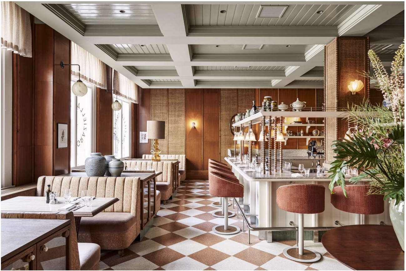
Het nieuwe restaurant Graziella in De l'Europe