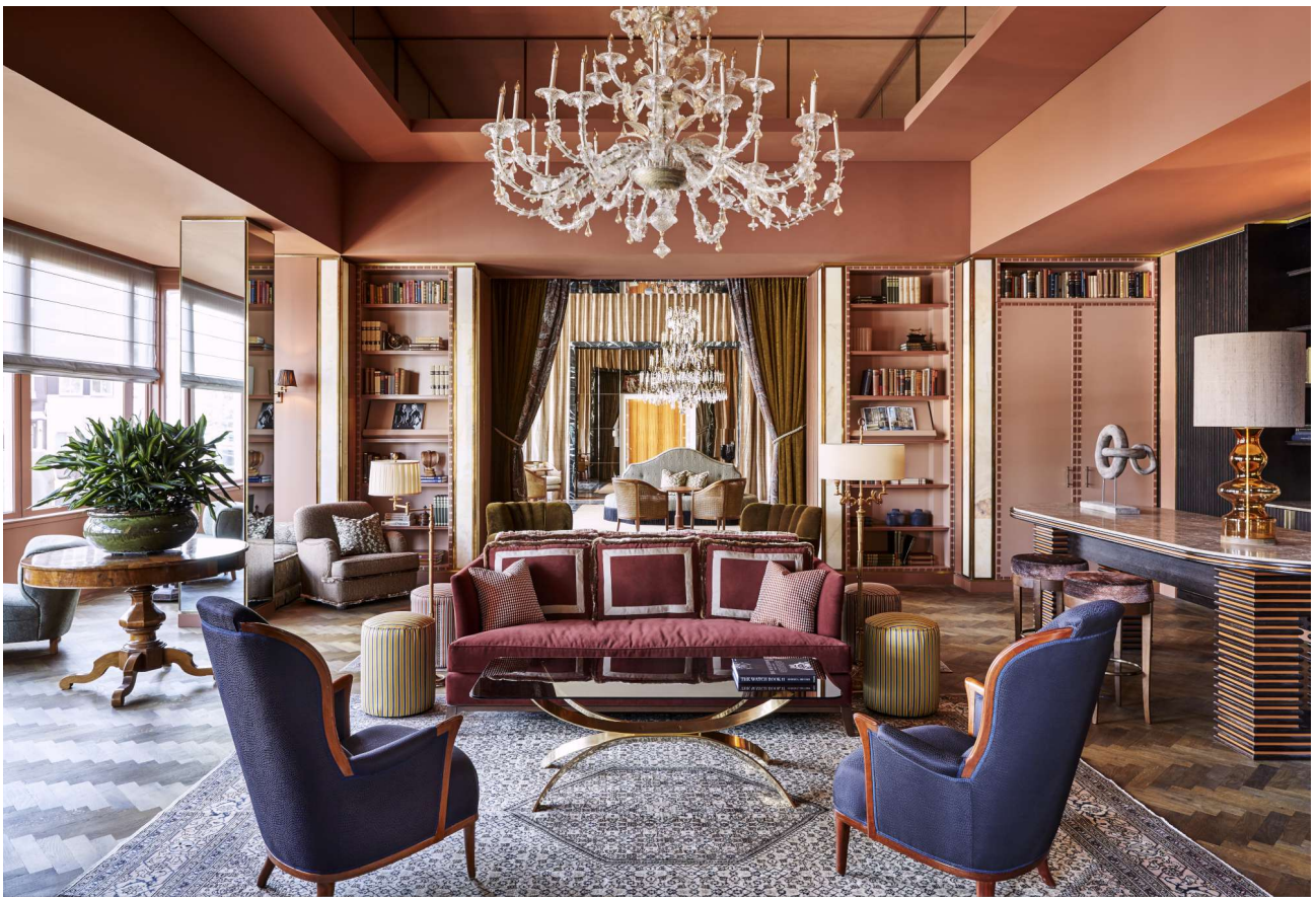
De library room van De l'Europe

Zo is een aantal 17e eeuwse werken van Hollandse schilders die voorheen in de Heinekenkamer hingen en dus alleen zichtbaar waren voor gasten in die ruimte, nu opgehangen in de lounge en voor alle gasten zichtbaar. De schilderijen komen uit de privécollectie van de familie Heineken en zijn in het verleden aan het hotel – ook eigendom van de familie – geschonken.